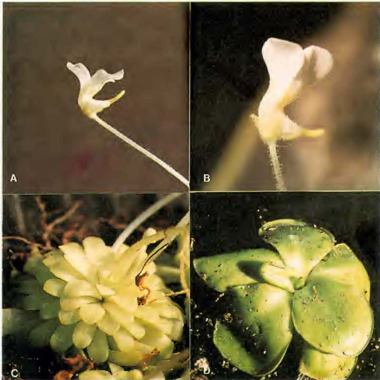
Fig. 2. Pinguicula mirandae Zamudio et A. Salinas. A-B. Vista lateral de la flor; C. Roseta "de invierno"; D. Roseta "de verano".

acuminata Benth., son las únicas especies de la sección Heterophyllum con hojas de "verano" anchas, espatuladas o suborbiculares, con el margen ligeramente involuto; las de la primera son muy parecidas a las de Pinguicula colimensis McVaugh et Mickel y las de la segunda a las de Pinguicula macrophylla HBK., de manera que si se colectan las plantas sólo con las rosetas de "verano", es difícil dilucidar su identidad. Lo anterior es una muestra de que ha ocurrido un paralelismo evolutivo en la diferenciación de los tipos de hojas dentro de cada uno de los subgéneros de Pinguicula .